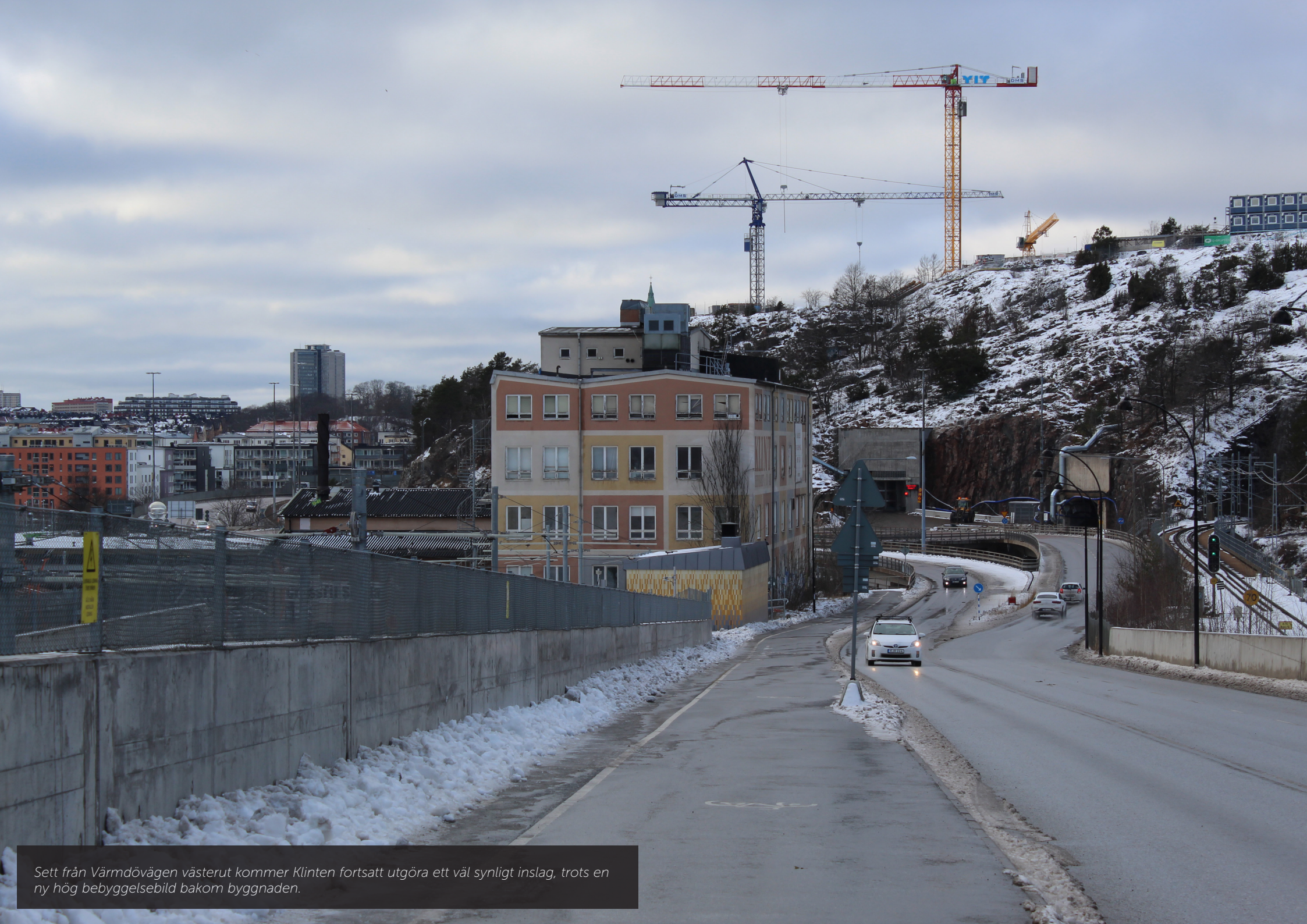
Sett från Värmdövägen västerut kommer Klinten fortsatt utgöra ett väl synligt inslag, trots en ny hög bebyggelsebild bakom byggnaden.