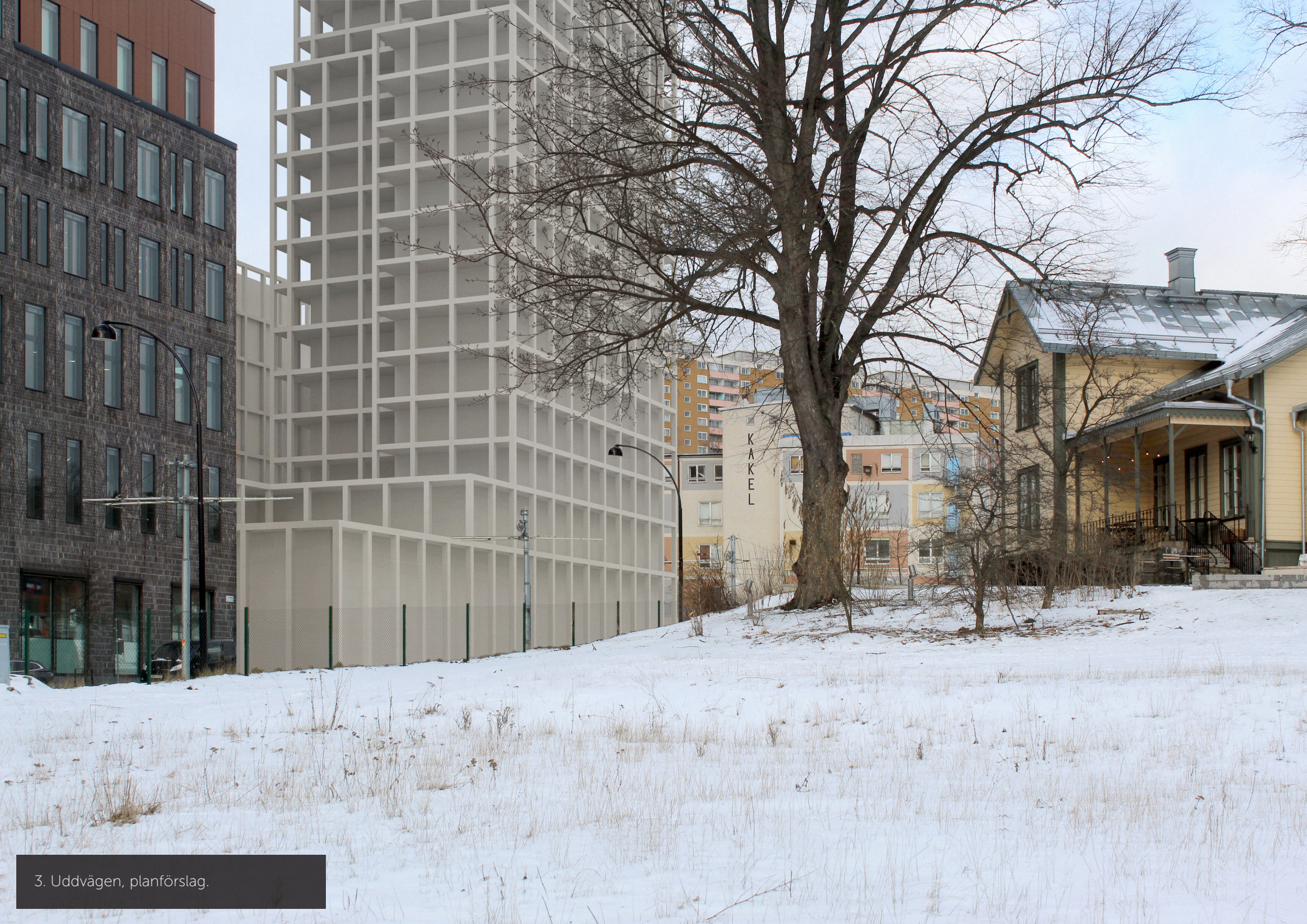
3. Uddvägen, planförslag.