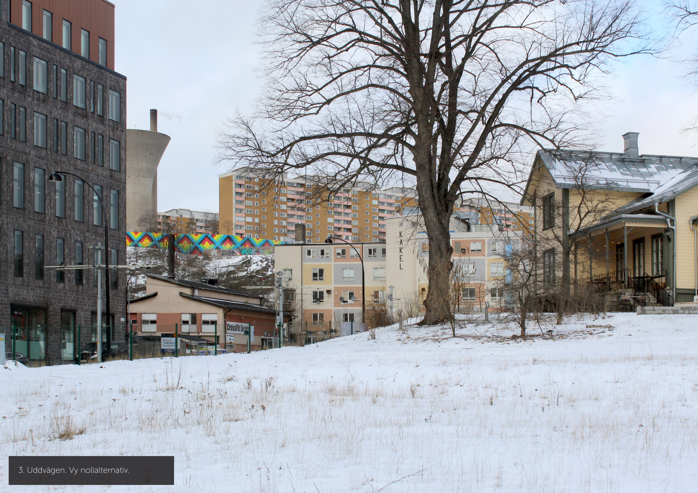
3. Uddvägen. Vy nollalternativ.