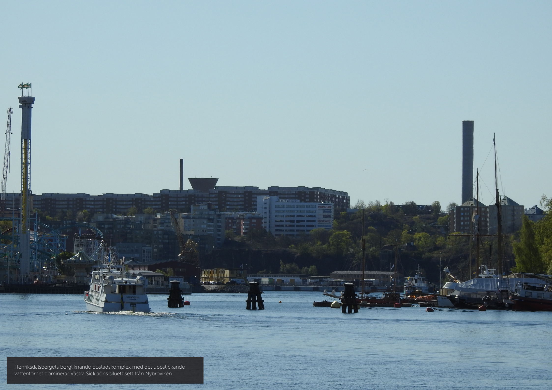
Henrikdalsbergets borgliknande bostadskomplex med det uppstickande vattentornet dominerar Västra Sicklaöns siluett sett från Nybroviken.