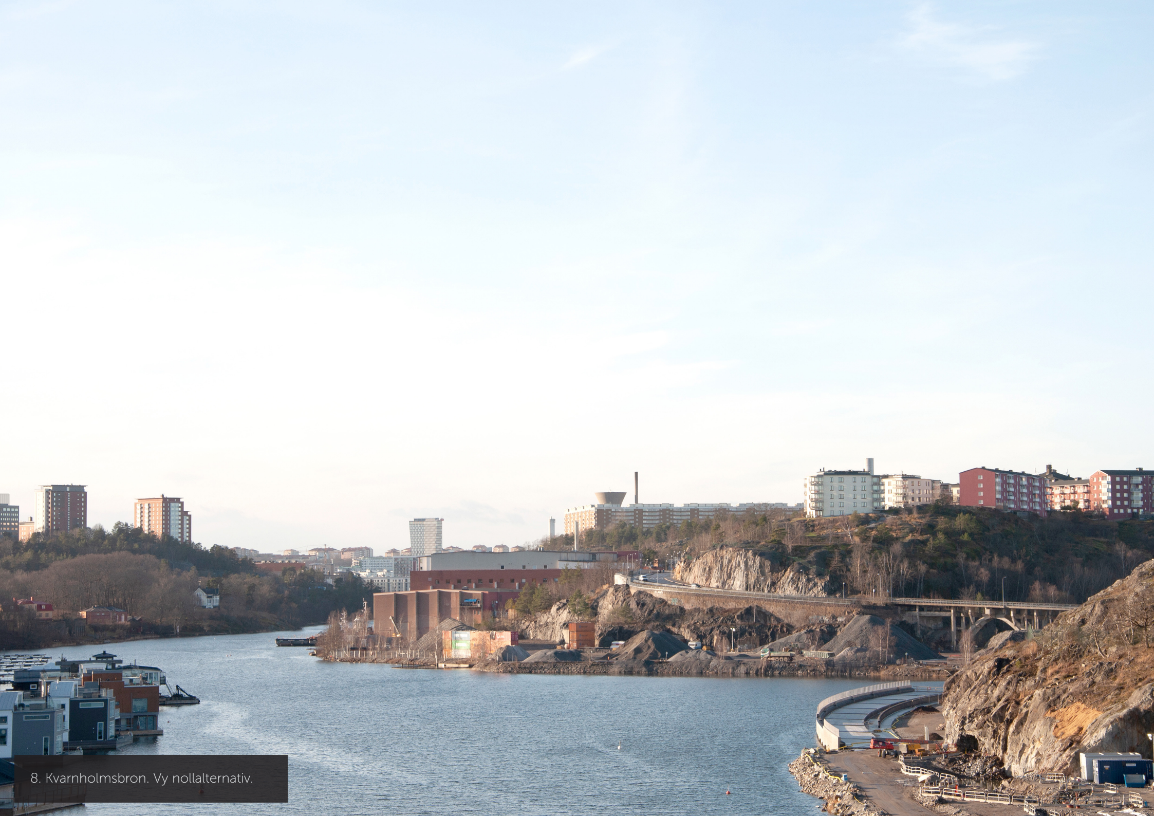
8. Kvarnholmsbron. Vy nollalternativ.