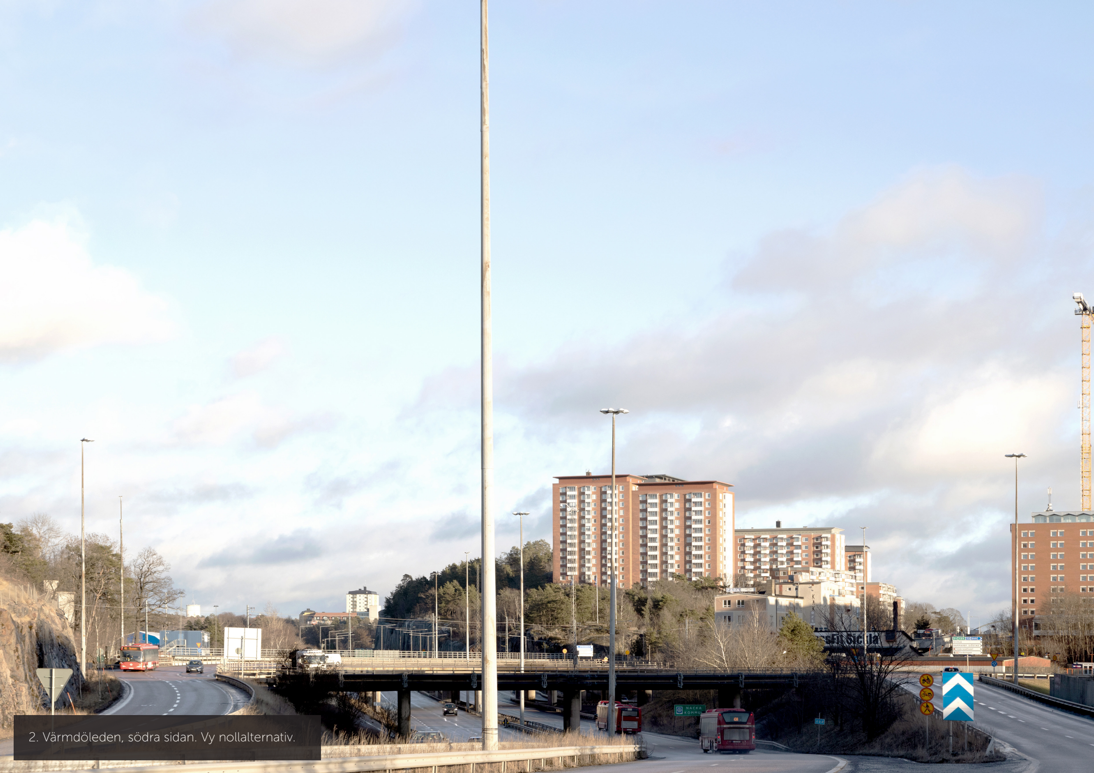
2. Värmdöleden, södra sidan. Vy nollalternativ.