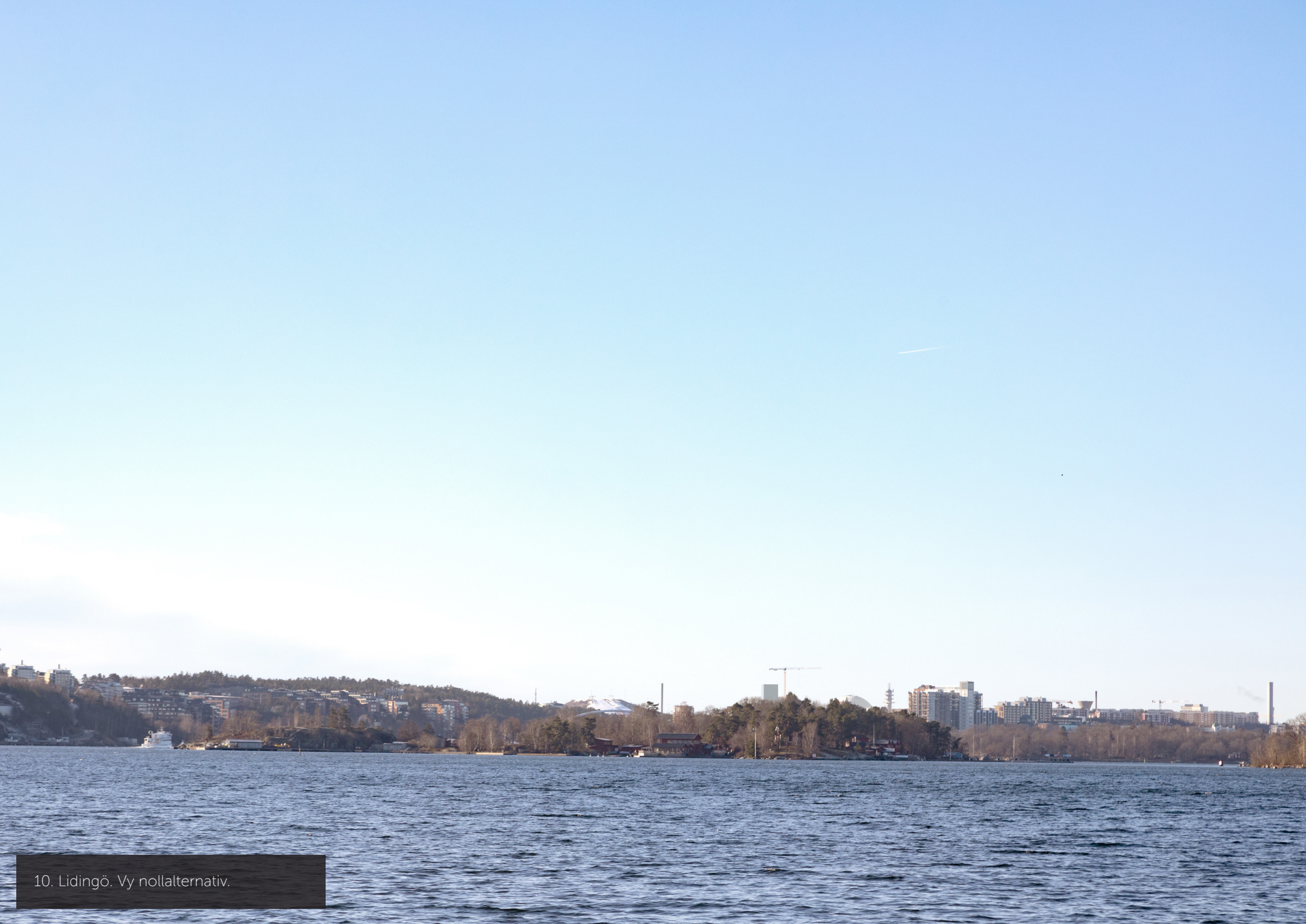
10. Lidingö. Vy nollalternativ.