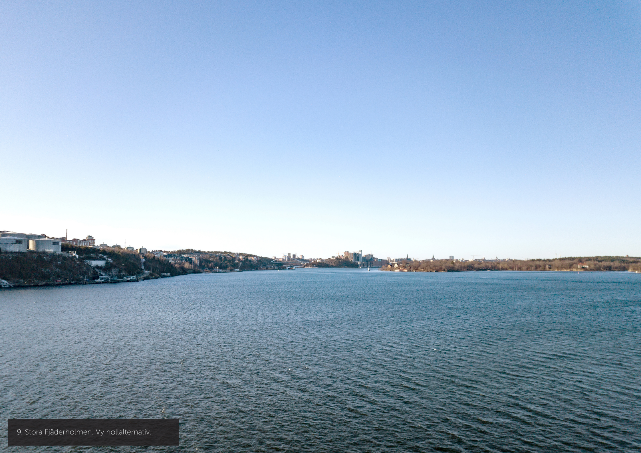
9. Stora Fjärderholmen. Vy nollalternativ.