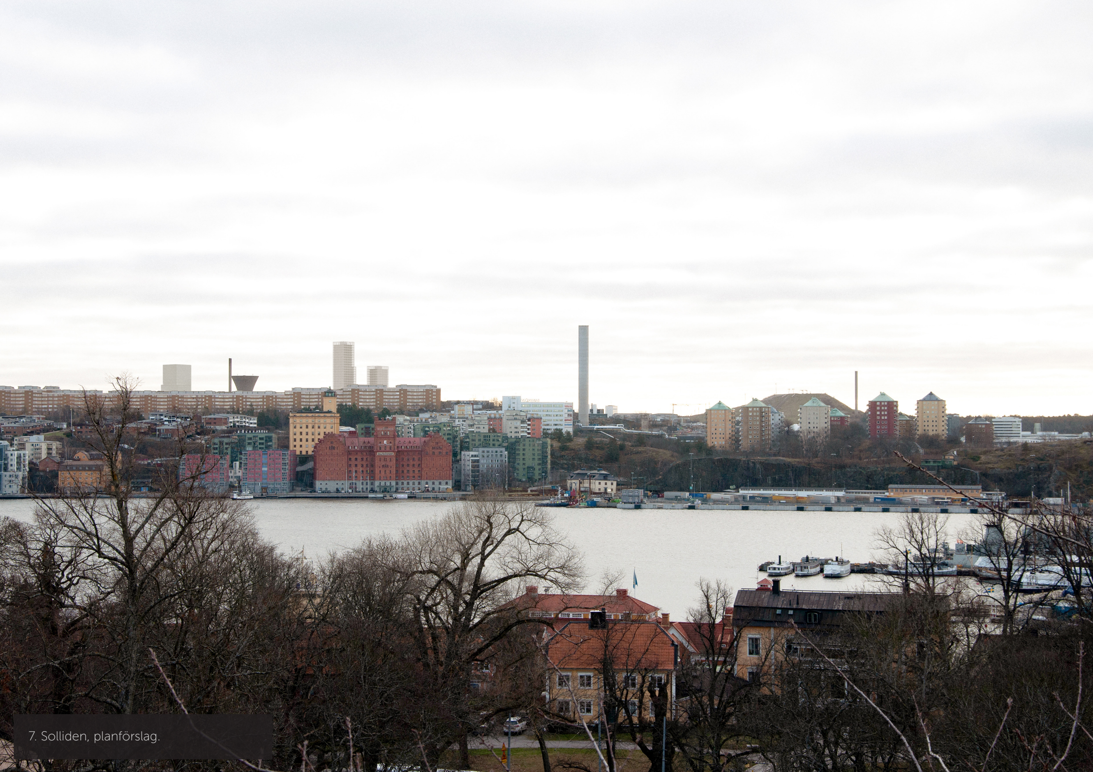
7. Solliden, planförslag.