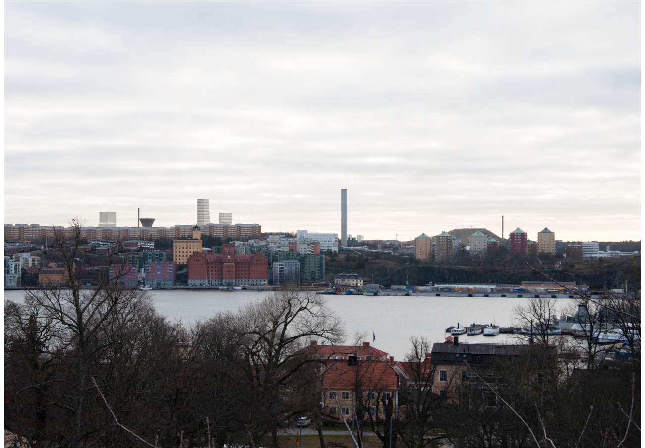
Vy från Solliden mot Västra Sicklaön. Planförslagets byggnadsvolymer visas tillsammans med föreslagen volym för Sickla stationshus.

De föreslagna byggnadsvolymer om 30 respektive 40 våningar kommer att bli ett nytt påtagligt inslag i stadsbilden, både sett från delar av Stockholms innerstad – såsom Skeppsbron, Nybroviken, Strandvägen och Solliden- och från stora delar av Stockholms inlopp. Trots att de föreslagna volymerna blir ett nytt inslag kring Stockholms vattenrum bedöms förslaget inte påverka riksintresset Stockholms innerstad. Detta för att volymerna