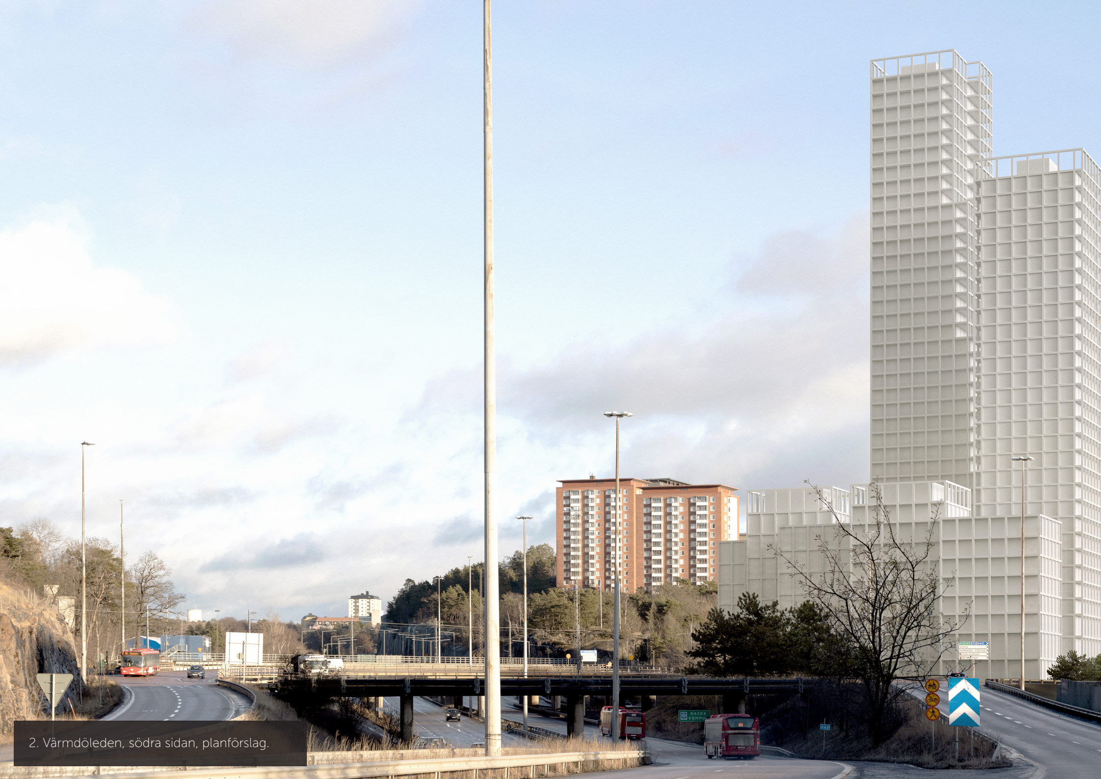
2. Värmdöleden, södra sidan, planförslag.