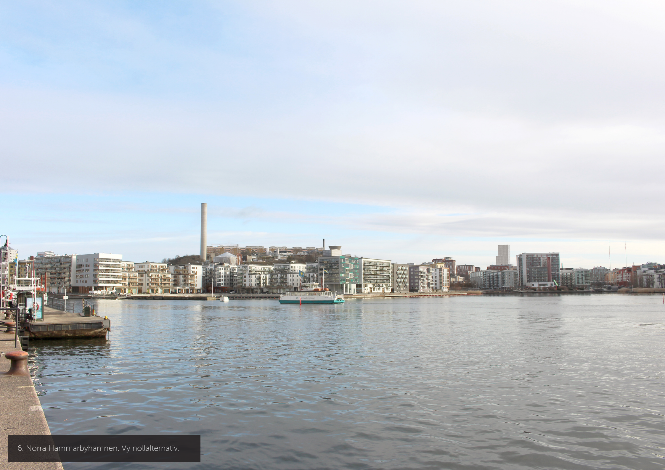
6. Norra Hammarbyhamnen. Vy nollalternativ.