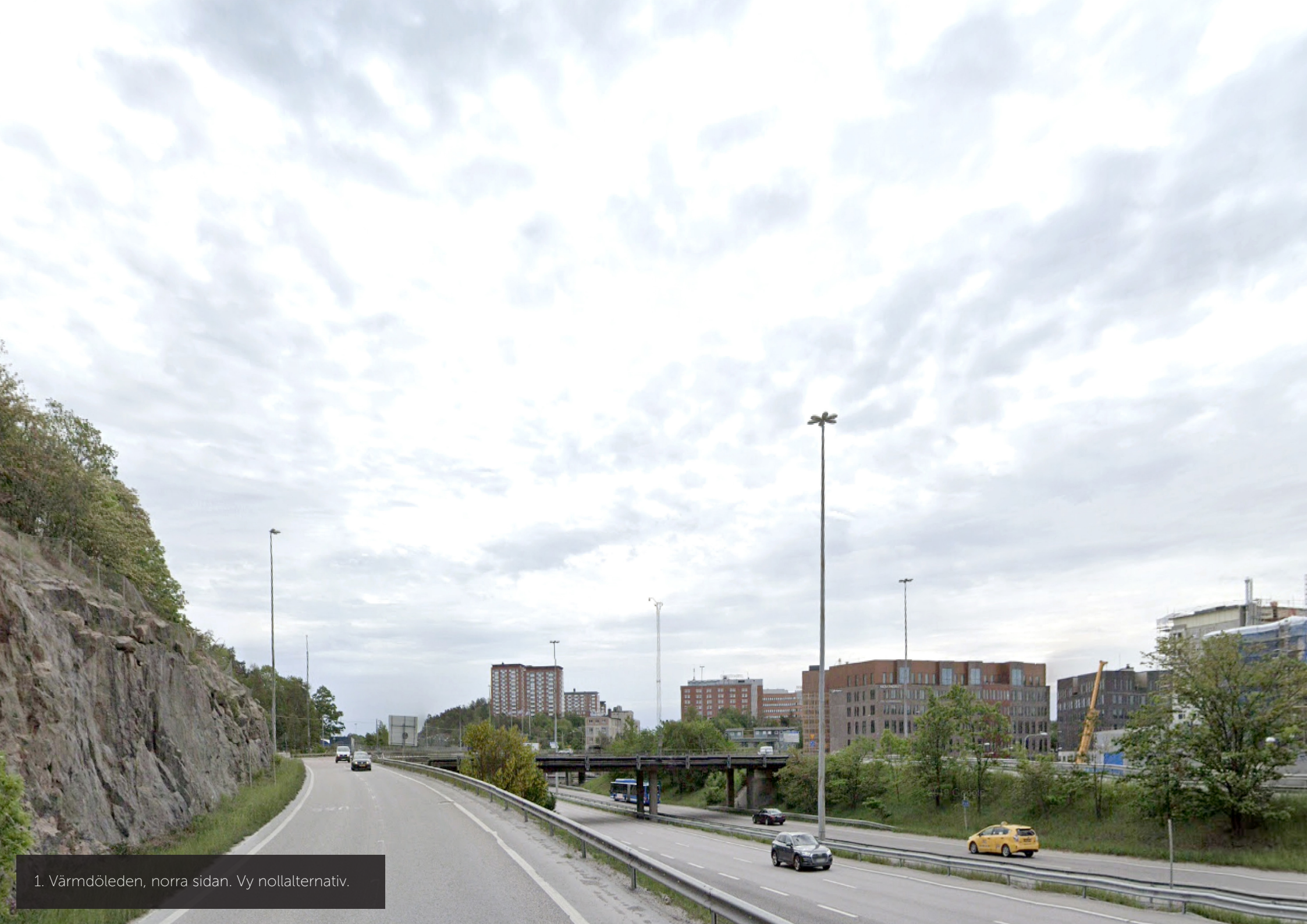
1. Värmdöleden, norra sidan. Vy nollalternativ.