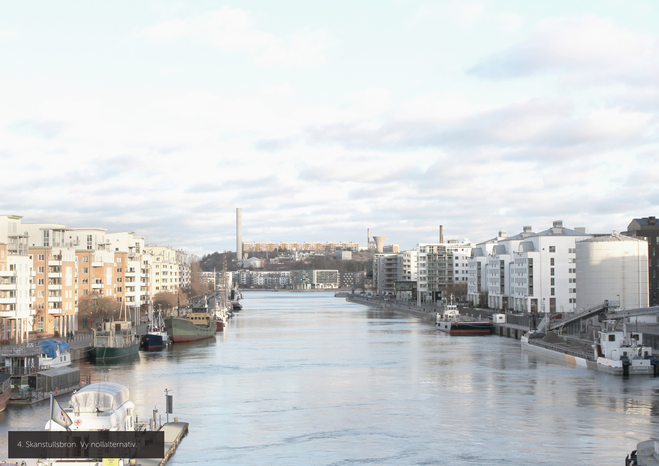
4. Skanstullsbron. Vy nollalternativ.