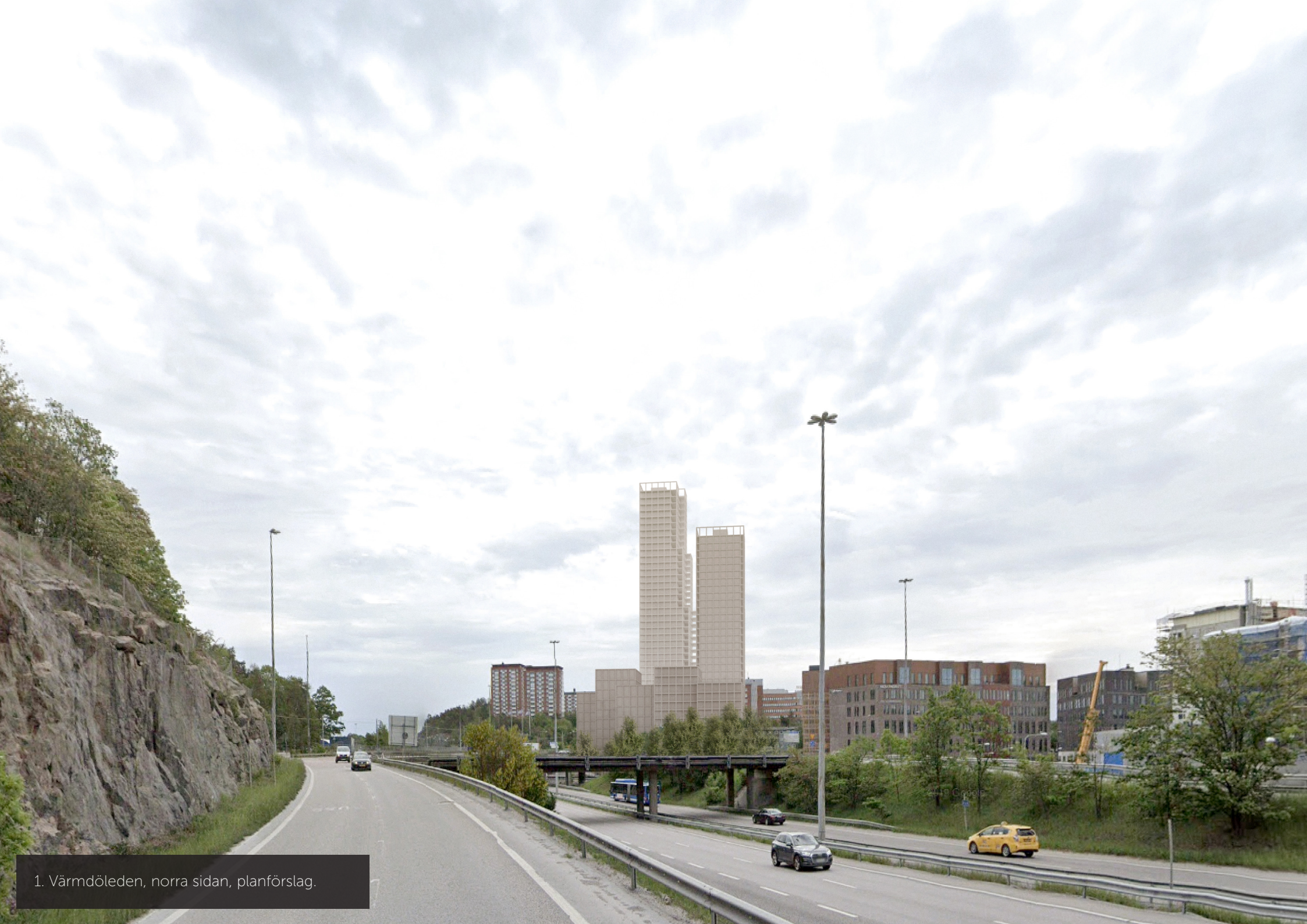
1. Värmdöleden, norra sidan, planförslag.