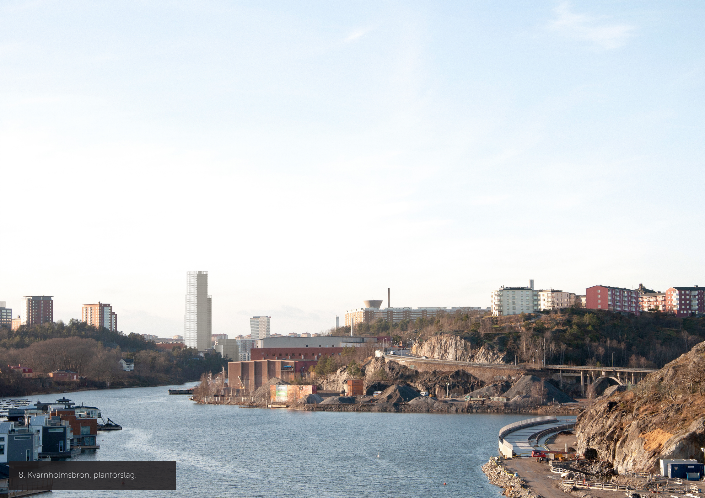
8. Kvarnholmsbron, planförslag.