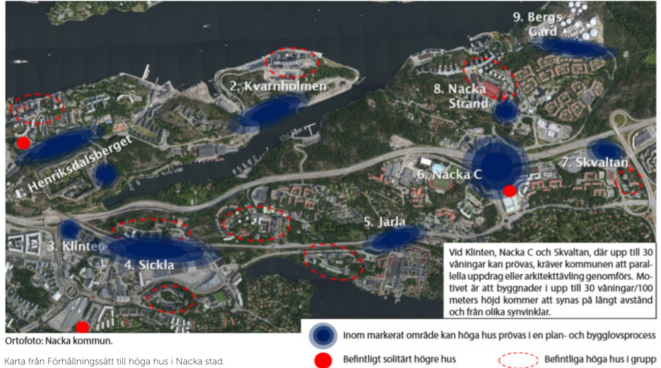
Karta från Förhållningssätt till höga hus i Nacka stad.

Ett flertal detaljplaner som avser högre bebyggelse inom områden utpekade i PM Förhållningssätt till höga hus i Nacka är under framtagande. Sammantaget kan dessa planer påverka hur aktuellt projekt Nacka port uppfattas i landskapet. Detaljplan Sickla stationshus vann laga kraft i december 2021. Detaljplanen medger bland annat en byggnad om 23 våningar och högsta angiven totalhöjd